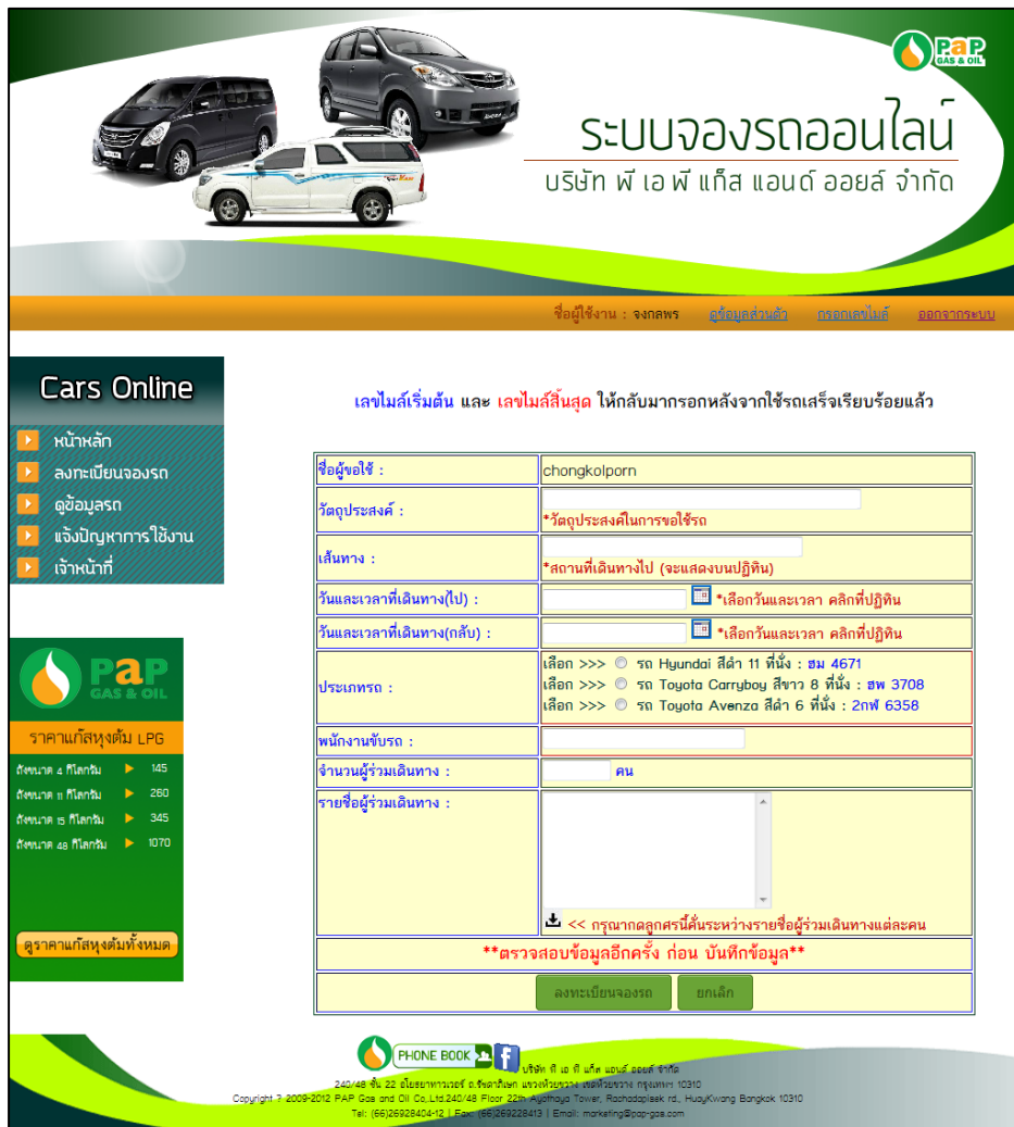
ภาพที่ 3 แสดงหน้าการลงทะเบียนข้อมูล

หากต้องการจองรถ สามารถคลิกได้ที่เมนู ลงทะเบียนจองรถ (ภาพที่ 3) จากนั้นทำการกรอกข้อมูลให้ครบถ้วน เมื่อกรอกข้อมูลครบถ้วนแล้ว คลิก ลงทะเบียนจองรถ