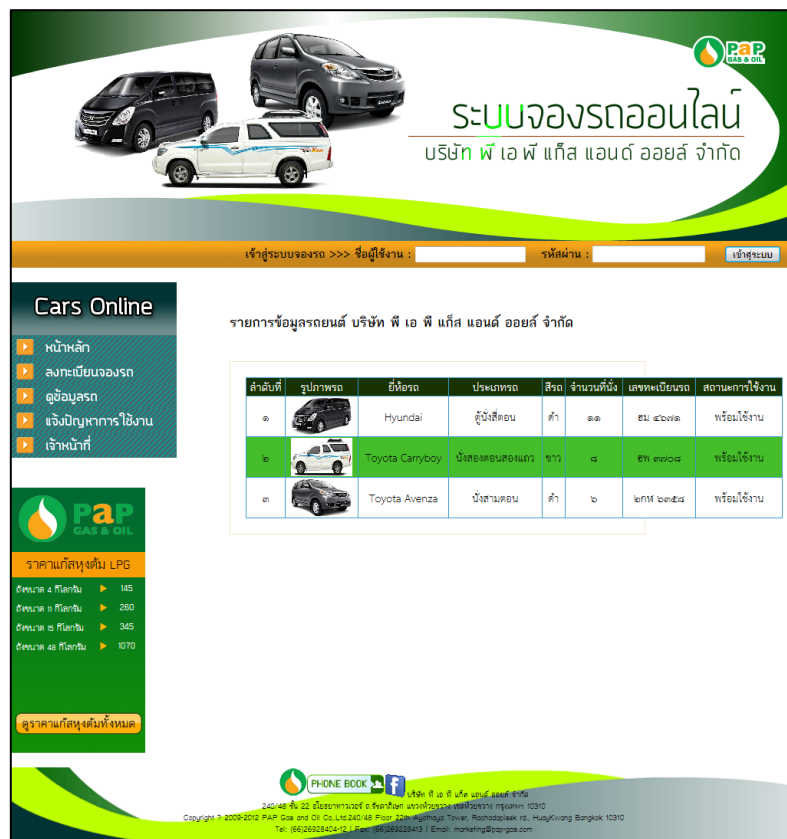
ภาพที่ 2 แสดงหน้าดูข้อมูลรถ

เมื่อคลิกที่เมนู ดูข้อมูลรถ จะแสดงรายละเอียดเกี่ยวกับรถแต่ละคัน ดังภาพที่ 2